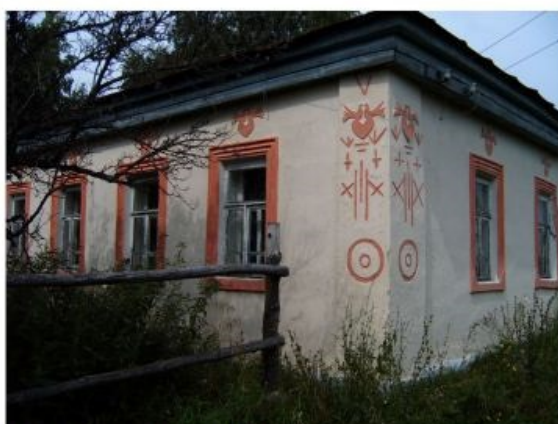
Общий вид дома с юго-запада