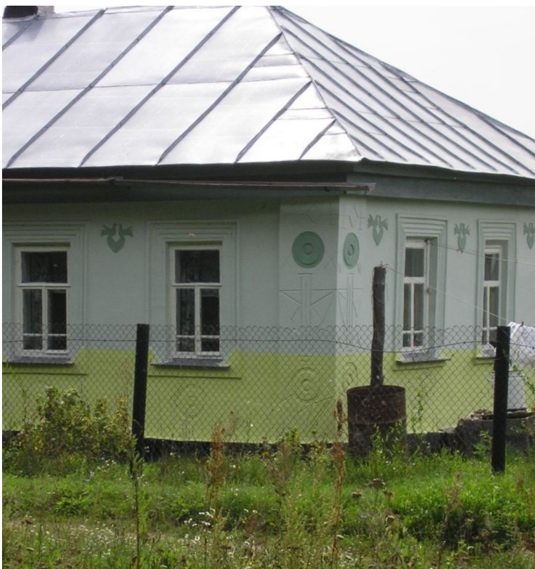
Рис. 4. Дом № 4 (вероятно, ул. Речная).