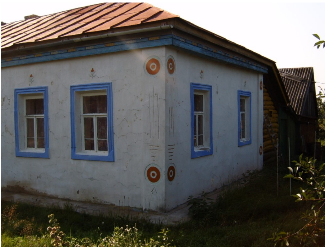
Рис. 3. Дом № 3 (ул. Центральная).

пилястра северо-западного угла орнаментирована так же, только галочки внизу отсутствуют. Под верхним кругом изображены по бокам две галочки острием вниз, а верхняя часть средней вертикальной линии имеет разрыв на уровне высоты боковых линий. Западная пилястра юго-западного угла орнаментирована только сверху и снизу двумя кругами.