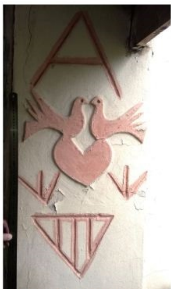
Юг. Справа от двери