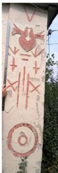
Юг. Правый угол