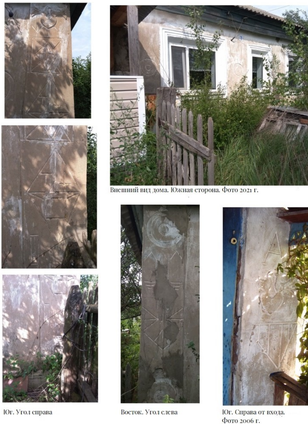
Рис. 2. Дом № 2 (ул. Центральная).

датой постройки всех четырех домов можно считать первую половину – середину XX в. Фотографии домов были сделаны в 2003 г. (дома № 3–4) и 2021 г. (дома № 1–2). Часть «входной группы» дома № 2 сохранилась лишь на старой фотографии.