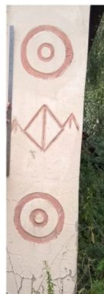
Восток. Правый угол