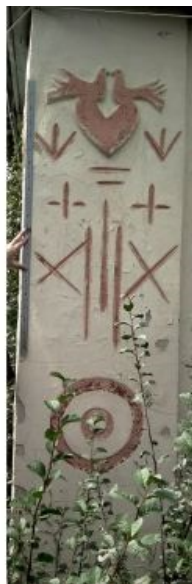
Юг. Левый угол