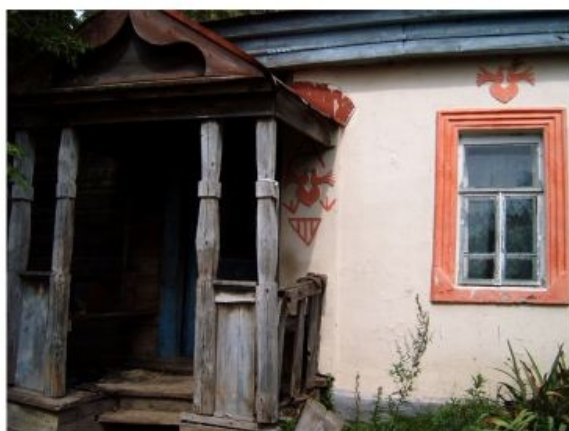
Входная группа с юга