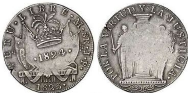
Илл. 10. Перу. Монета достоинством в 8 реалов 1824 г. Серебро (Sánchez Abrego 2017. P. 8).

Надчеканов в виде короны было несколько разных типов, и они могли накладываться на обе стороны монеты (илл. 10). Я полагаю, что в данном случае могла иметь место ритуальная диффамация революционных знаков со стороны роялистов. Вполне соответствующая тому, что было проделано ранее доньей Марией Консепсьон Лоперена де Фернандес де Кастро в 1813 г. по отношению к своему бывшему королю, когда она заявила, что она теперь «свободная женщина, происхождения роялистского, но ныне республиканка» («Mujer libre, de origen realista pero hoy republicana»), и показательно сожгла портрет короля и его герб (Lux Martelo 2014. P. 121).