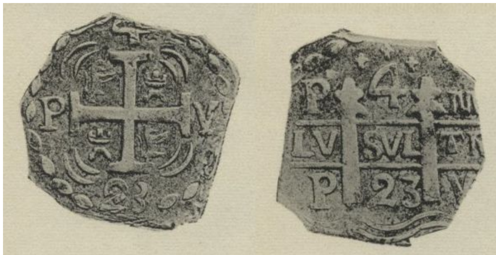
Илл. 12. Испанская империя. Фердинанд VII. Провинция Мендоса. Монета достоинством в 4 реала. 1823 г. Серебро (Zabala, Burzio, Pardo 1947. P. 104. Lamina XVIII. Fig. 4).