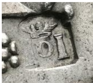
Илл. 6 а. Надчекан 8 реалов Оахаки.

Также известен целый ряд монет без указания на место чеканки. По наличию имени короля, короны, погрудного изображения монарха и других деталей можно предположить, что они были отчеканены роялистами. Вполне вероятно, что некоторые из них – например, те, на которых изображено оружие – могли бы быть причислены к монетам с изобразительными девизами, но, к сожалению, причины, побудившие их изготовителей разместить на монетах то или иное изображение, нам неизвестны, а доступно лишь их описание: