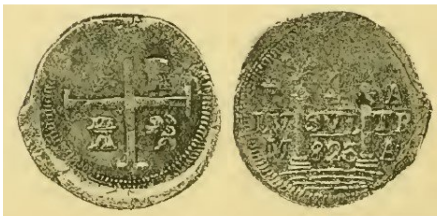
Илл. 13. Испанская империя. Фердинанд VII. Провинция Мендоса. Монета достоинством в 4 реала. 1823 г. Серебро (Peña 1892. P. 160).

Также в Мендосе монеты, прибывшие туда тем или иным путем, надчеканивались роялистами специальным клеймом, где в центре были изображены весы, а вокруг имелась надпись «FIDELIDAD» («Верность») (илл. 14).