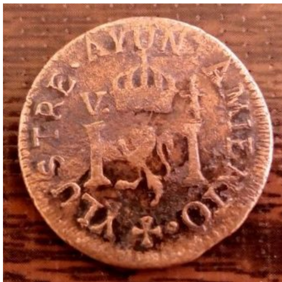
Илл. 5а. Испанская империя. Фердинанд VII. Епископство Сьерра-де-Пинос (автономное королевство Новая Галисия в составе вице-королевства Новая Испания). Аверс.

На реверсе (илл. 5б) изображен замок между колоннами, на одной из которых изображена литера «D», а над другой «PP», вокруг всей композиции – дата и легенда, обозначающая место происхождения: «DE SIERRA DE PINOS» («Отчеканена в Сьерра-де-Пиносе»).