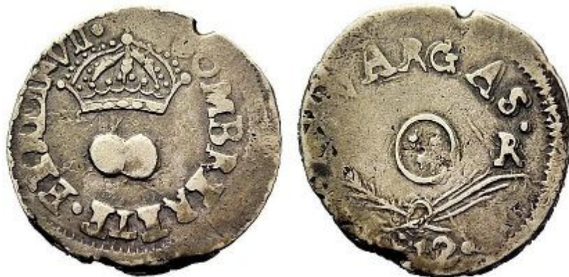
Илл. 1. Испанская империя. Фердинанд VII. 1 реал. Сомбререте (совр. Мексика), 1812 г. Серебро. Источник: Sayón Subastas Online Auction 18 (24 September 2014), lot 290 (URL: https://www.numisbids.com/n.php?p=lot&sid=858&lot=290 [25.01.2021]).