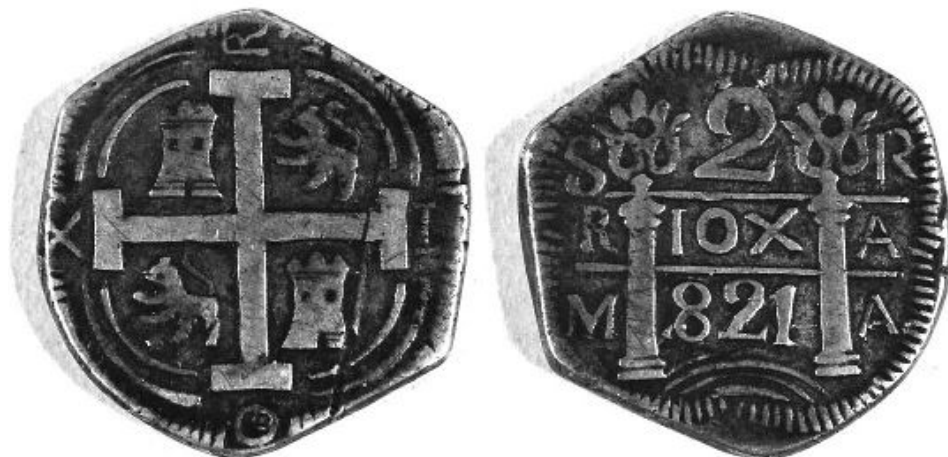
Илл. 15. Испанская империя. Фердинанд VII. Провинция Риоха. Монета достоинством в 2 реала. 1821 г. Серебро (Cohen 2016. Р. 99).

Отметим, что свободное изменение изобразительного девиза в виде Геркулесовых колонн, почетных лент и словесного девиза, размещенного на них «Patriae Infelici Fidelis» («Верный несчастной родине»), и