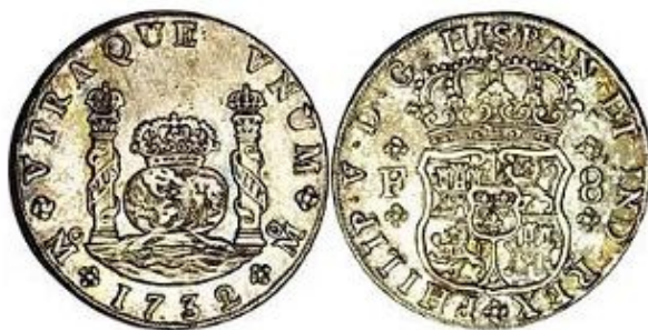
Илл. 3. Испанская империя. Фердинанд VII. Монета достоинством в 8 реалов. Мехико, 1732 г. Серебро (Lanzarote 2020. P. 31).

В 1732 г. сначала в Новой Испании, а затем и в других американских вице-королевствах стали чеканить монеты, на которых были размещены измененные государственные изобразительные девизы. На илл. 3 представлена первая монета такого типа, отчеканенная в Мехико. На ее реверсе изображены увенчанные коронами Геркулесовы столбы, увитые лентами с надписью «PLUS ULTRA», море и два полушария, увенчанные короной; вокруг – дата, знак монетного дома и легенда: «UTRA QUE UNUM» («Двое как один»). На аверсе изображен венчаный герб, номинал, литера «F», обозначающая Филиппа V, и легенда «PHILIP V D G HISPAN ET IND REX» (Lanzarote 2020. P. 31).