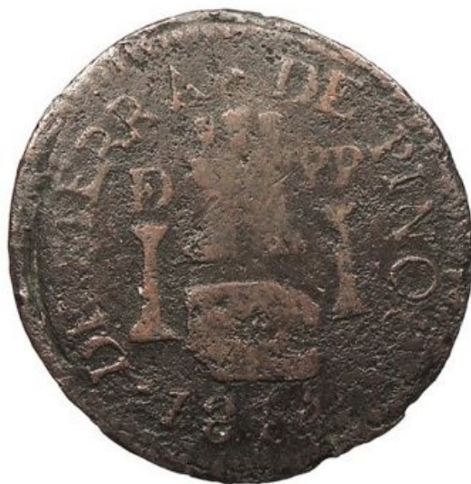
Илл. 5б. Испанская империя. Фердинанд VII. Епископство Сьерра-де-Пинос (автономное королевство Новая Галисия в составе вице-королевства Новая Испания). Монета достоинством в \frac{1}{4} реала. 1814 г. Медь. Реверс.