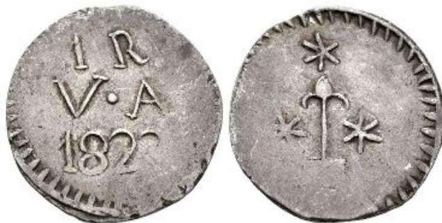
Илл. 11. Вальдивия (Чили). Монета достоинством в 1 реал. 1822 г. Серебро. Источник: Numis Bids. Lot 495 // URL: https://www.numisbids.com/n.php?p=lot&sid=3672&lot=495 (21.03.2021).