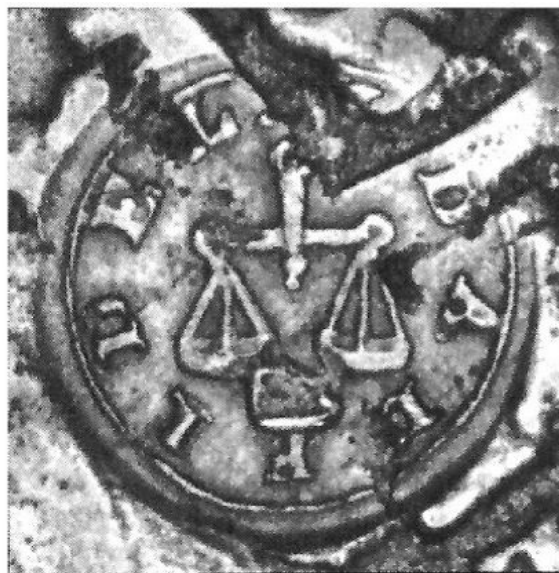
Илл. 14. Клеймо-надчекан г. Мендосы (Chao 2016. Р. 133).

ражено слово «RIOXA». В третьем ряду помещены литеры «М» и «А», между которыми помещена дата «821». Т.Х. Медина полагал, что последние литеры обозначали слово «Mendoza» (Medina 1919. Р. 139–140). Некоторые исследователи полагают, что, по существу, тип монеты не был изменен за исключением легенды и других незначительных деталей (Zabala, Burzio, Pardo 1947. Р. 91). Однако с точки зрения геральдики мы имеем пример самовольного искажения словесного девиза (илл. 15).