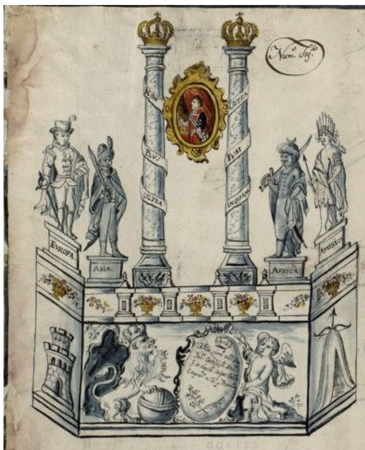
Илл. 4. Сцена с изобразительными девизами, сооруженная в честь коронации Фердинанда VII (Rodríguez Moya, Mínguez Cornelles 2012. P. 139. Fig. 8).

нотаций, пародию на гербового орла Наполеонов. Правой лапой лев опирался на земной шар, констатируя свою силу и право владеть империей, где никогда не заходит солнце. Этот сюжет хорошо известен в испанской королевской эмблематике (Елохин 2020. С. 101–102). Также были изображены ангел или гений, посвящавший королю стихи, и палатка со снаряженным луком – знаком готовности к войне. Рядом с колоннами были изображены мужские аллегорические персонификации Европы, Азии, Африки и Америки. Для нашего исследования важно то, что уже в самом начале правления Фердинанда VII с точки зрения американских подданных изобразительный девиз был по своему значению важнее герба или отдельных гербовых фигур (илл. 4).