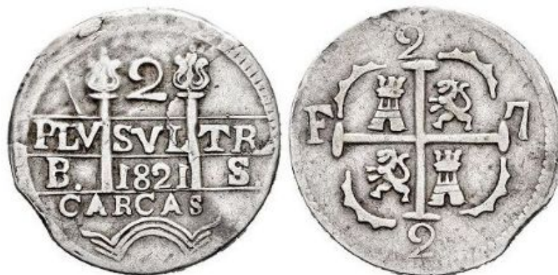
Илл. 7. Испанская империя. Фердинанд VII. Каракас. Монета достоинством в 2 реала. 1821 г. Серебро.