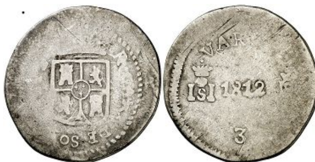
Илл. 2. Испанская империя. Фердинанд VII. Монета достоинством в 3 реала. Сомбререте де Варгас (совр. Мексика), 1812 г. Серебро, Источник: Numis Bids. Lot 610 (URL: https://www.numisbids.com/n.php?p=lot&sid=1041&lot=610 [21.03.2021]).