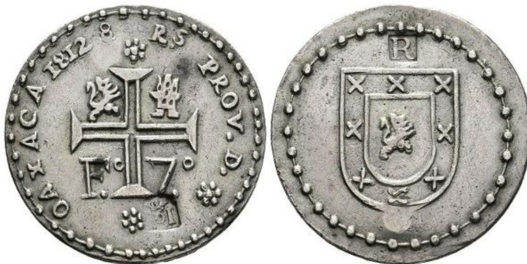
Илл. 6. Испанская империя. Фердинанд VII. Оахака. Монета достоинством в 8 реалов. 1812 г. Серебро.

эмиссии). Обратим особое внимание на редчайший для испанской геральдики надчекан на аверсе в виде изобразительного девиза – Геркулесовых колонн и коронованной буквы «O», очевидно, обозначающей Оахаку (илл. 6а).