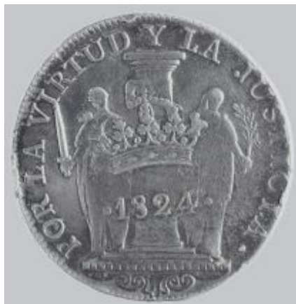
Илл. 9. Монета достоинством в 8 реалов «Свободное Перу», отчеканенная по приказу генерала Сан Мартина с надчеканом в виде короны на реверсе. 1824 г. Серебро (Monedas Americanas 2013. P. 70).

Надчеканов в виде короны было несколько разных типов, и они могли накладываться на обе стороны монеты (илл. 10). Я полагаю, что в данном случае могла иметь место ритуальная диффамация революционных знаков со стороны роялистов. Вполне соответствующая тому, что было проделано ранее доньей Марией Консепсьон Лоперена де Фернандес де Кастро в 1813 г. по отношению к своему бывшему королю, когда она заявила, что она теперь «свободная женщина, происхождения роялистского, но ныне республиканка» («Mujer libre, de origen realista pero hoy republicana»), и показательно сожгла портрет короля и его герб (Lux Martelo 2014. P. 121).