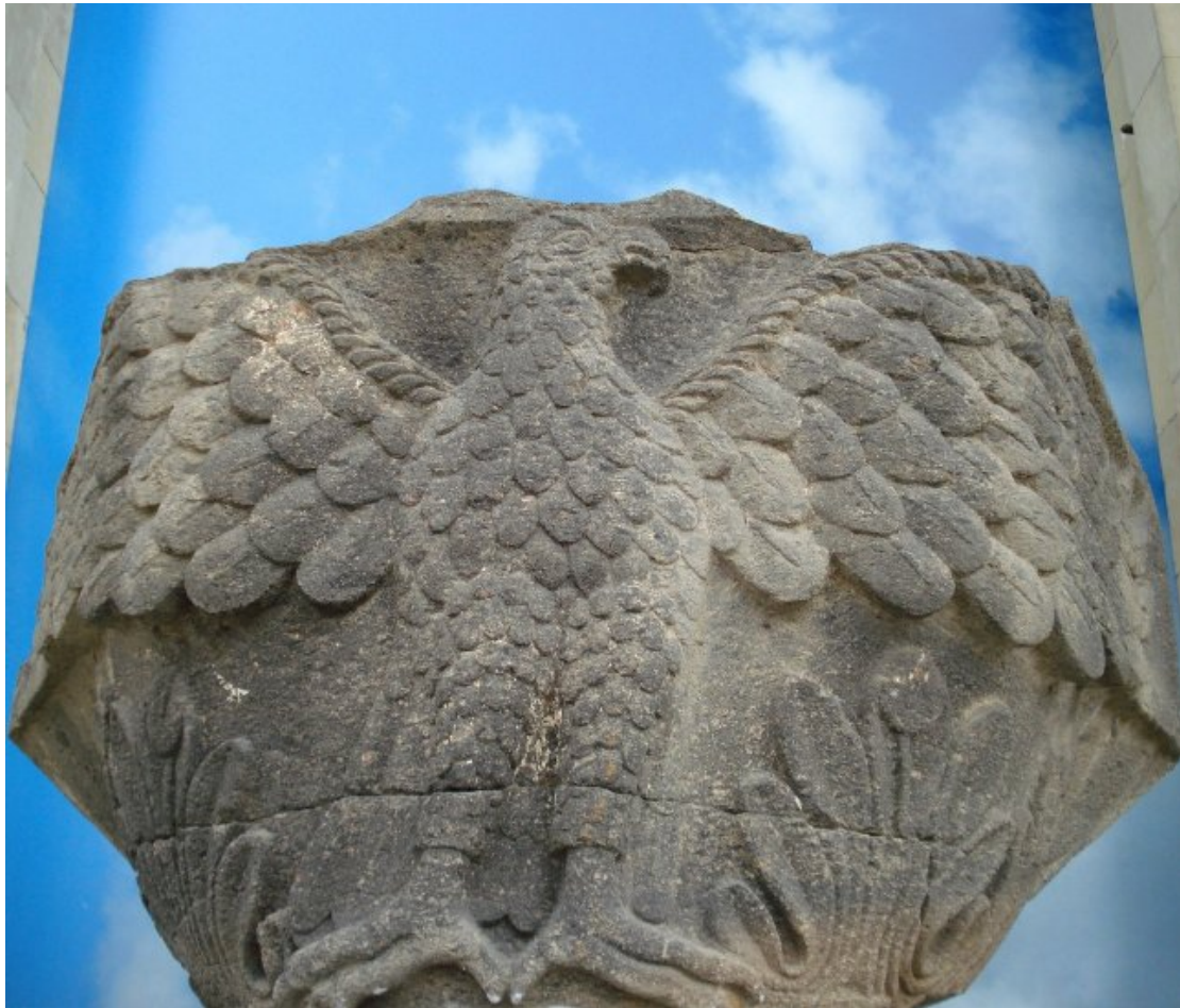
Илл. 6. Капитель с изображением орла. Звартноц. Фрагмент рельефного убранства внутренней обходной галереи собора. 652 г. Музей заповедник «Звартноц». Армения.

тии, т. к. подписи-монограммы многих императоров этого времени (Константина, Маврикия, Ираклия) сохранились на византийских памятниках (Maranci 2016. Р. 116–117, 160), но особенно на памятниках Святой Земли (Tarkhanova 2022. Р. 536–547). Греческие монограммы, а также сохранившиеся строительные надписи Звартноца и маленькой церкви в Олту в Тайке свидетельствуют о ярко выраженном грекофильстве католикоса. Несмотря на халкидонитство католикоса Нерсеса, все же верным представляется заключение исследователей о том, что образ храма Звартноц – это сознательное культурное обращение к ранне-средневековой и ранневизантийской традиции церковного строительства (Мнацаканян 1971. С. 8; Казарян 2012. С. 426, 438–439; Maranci 2016. Р. 136–144).