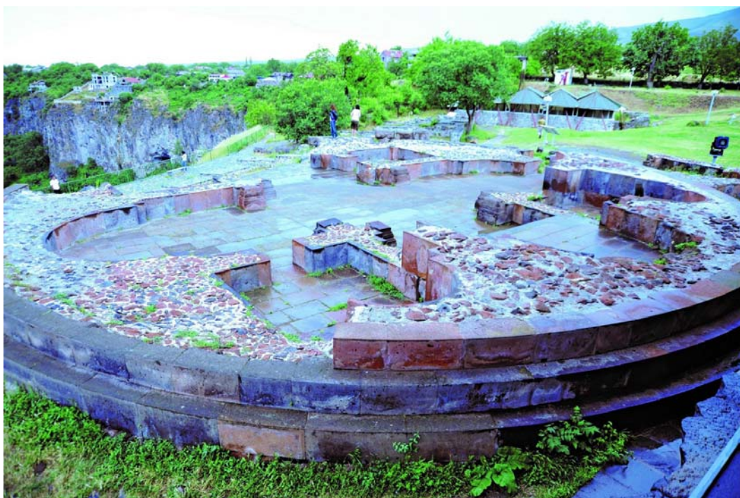
Илл. 11. Фундамент церкви в Гарни. Третья четверть VII в. Армения.

(ныне Турция). Согласно преданию, святые девы-Рипсимеанки по пути в Валаршапат нашли пристанище близ этой горы и спрятали здесь частицу св. Древа. Во времена католикоса Нерсеса отшельникам Тодику и Овелу было видение с указанием местонахождения частиц св. Древа. В ознаменование этого события католикосом был установлен церковный праздник, была построена церковь св. Знамени на месте чудесного видения, а также сочинен шаракан – торжественный гимн, посвященный Варагскому Кресту, начинающийся словами «Знамение Твоего все-сильного Святого Креста...».