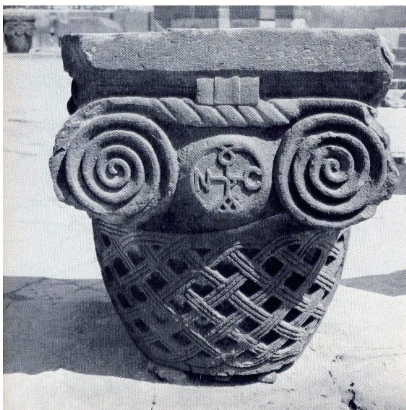
Илл. 7. Капитель с изображением монограммы Нерсеса Строителя. Звартноц, 652 г. Армения (воспроизводится по: Мнацакян 1971. Илл. 51).

С. 500–501). Кроме того, конха апсиды была украшена орнаментальным мозаичным поясом, от которого сохранился только фрагмент с изображением равноконечного креста (Акопян 2016. С. 135). Во время раскопок был найден фрагмент живописной декорации интерьера, имитирующий фактуру мрамора, что свидетельствует о желании заказчика воссоздать столичную византийскую традицию облицовки стен мраморными плитами (Акопян 2016. С. 137). Учитывая богатое внутреннее убранство храма (мозаики, фрески) и его обильное освещение из многочисленных широких окон, устроенных по внешним граням ротонды, можно представить какое сильное эмоциональное воздействие производил Звартноц на входящих в него верующих.