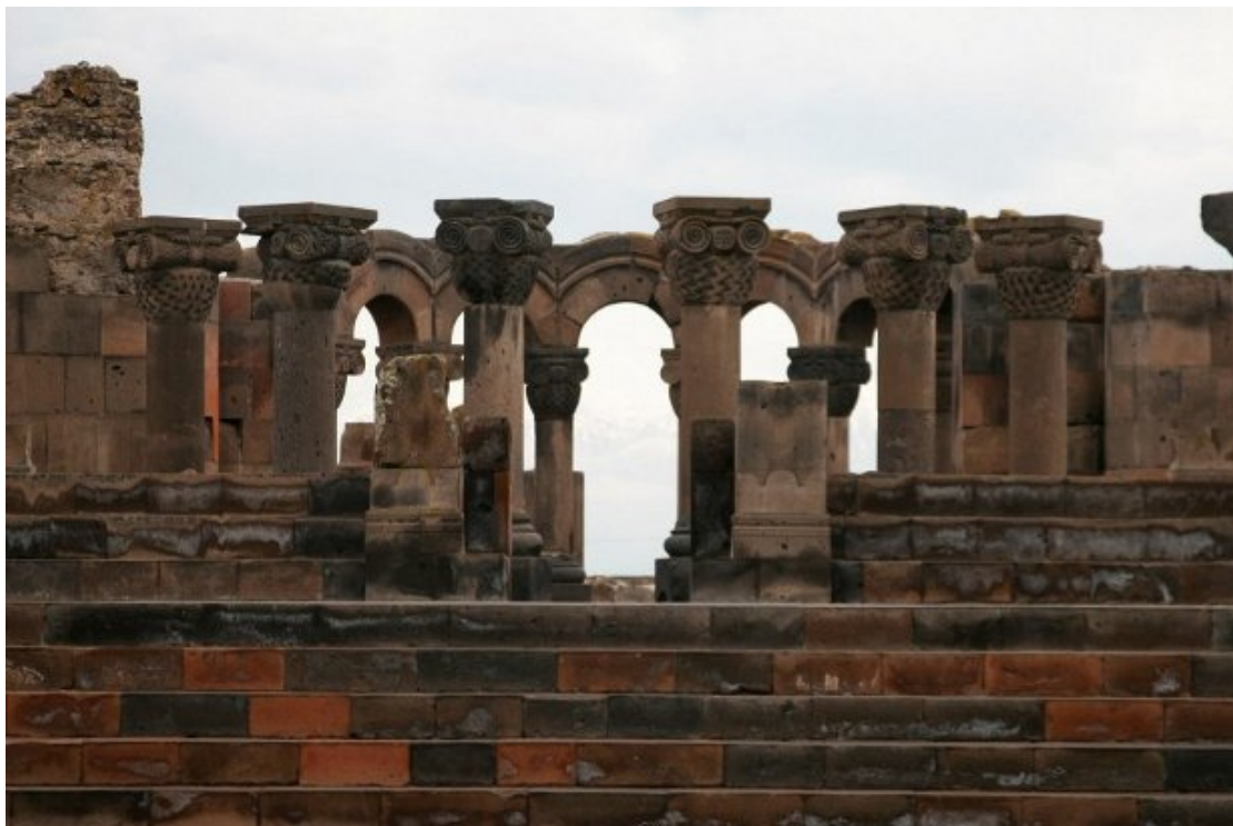
Илл. 3. Вид на храм Звартноц. Колонны внутреннего тетраконха и девятиступенчатый стилобат. 653 г. Музей-заповедник «Звартноц». Армения.

Возвращаясь к начальным годам деятельности католикоса Нерсеса, можно с уверенностью сказать, что после перестройки Двинского собора им была выстроена небольшая церковь в Хор Вирапе (641–643 гг.), на месте мученичества Григория Просветителя (над «колодецем»). Ст. Мнацаканян реконструирует это небольшое сооружение в виде двухъярусной купольной ротонды с внутренней восьмиколонной сквозной галереей (Мнацаканян 1971. С. 42. Рис. 20). Данное сооружение, которое еще стояло в XIII в., не дошло до наших дней. Однако сохранилось описание арабского историка аль-Мукаддаси (X в.), согласно которому, церковь в Хор Вирапе была купольной, октогональной в плане, выстроенной из белого камня, а апсиду украшала мозаичная композиция с изображением Богоматери (Караулов 1908. С. 16). В связи с этим вспоминается фрагмент из Двинского собора с изображением Богоматери.