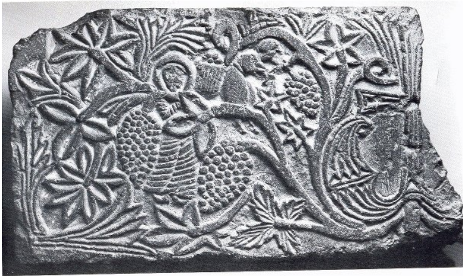
Илл. 1. «Сбор винограда». Двин. Левая часть притолоки Двинского кафедрального собора.