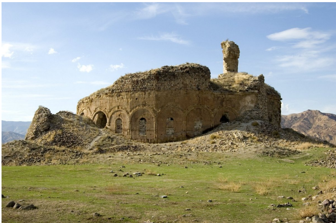
Илл. 5. Руины собора в Банаке. Середина VII в. Историческая провинция Тайк Великой Армении (ныне Турция).

Копией Звартноца считается Банак в Тайке, построенный тем же католикосом Нерсесом (Илл. 5).