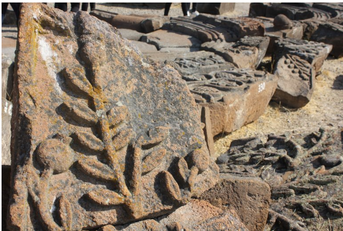
Илл. 8. Фрагменты пояса «Райского сада». Звартноц. 652 г. Фрагменты внешнего рельефного убранства первого яруса. Музей заповедник «Звартноц». Армения.

правило, сочетались с местными представлениями. Так, Мовсес Хоренаци (V в.) отождествлял с Небесным Иерусалимом страну Армению (Movsēs Xorenac'i 1993. P. 14–15), а по Лазарю Парпеци с Раем ассоциируется область Айрарат (Łazar P'arpec'i 1982. P. 23–24). Нет сомнения в том, что, задумав постройку Звартноца в Араратской долине, Нерсес руководствовался и этими традиционными представлениями. Об этом свидетельствует тот факт, что рядом с Звартноцем сразу после постройки дворцового комплекса католикос Нерсес посадил виноградники (Иованнес Драсханакертци 1986. Гл. XIX). Виноградник – образ Райского сада; Звартноц – символический образ Небесной Церкви. Подобные представления были сформированы на основе средневековых реалий. Как известно, с Армянского нагорья берут начало две библейские реки – Евфрат и Тигр, а согласно библейскому преданию, именно здесь Ной посадил свои первые виноградники (Petrosyan 2002. P. 425–426).