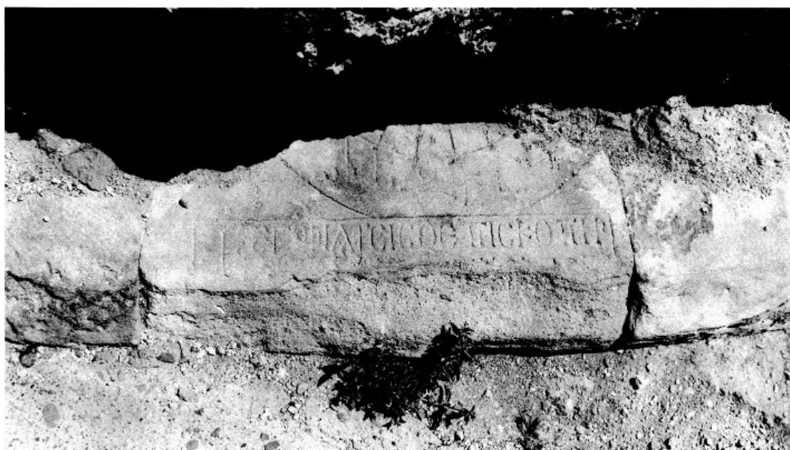
Илл. 10. Фрагмент греческой надписи Нерсеса Строителя. Церковь в Олти (ныне Турция). Третья четверть VII в. Историческая провинция Тайк Великой Армении.

этих перестроек храм только в общих чертах сохранил композицию первой, нерсесевской постройки. Сегодня можно с уверенностью сказать, что храм в Ишхане повторял композицию Двинского собора, т. е. представлял собой триконх (Казарян 2005. С. 13–17), и это важное уточнение объясняет появление и развитие типа крестово-купольного триконха на территории Тайка в период правления Багратидов, а также появление ряда церквей с аналогичной плановой композицией на территории Западной Грузии того же времени (Казарян 2005. С. 22–24, 26–27).