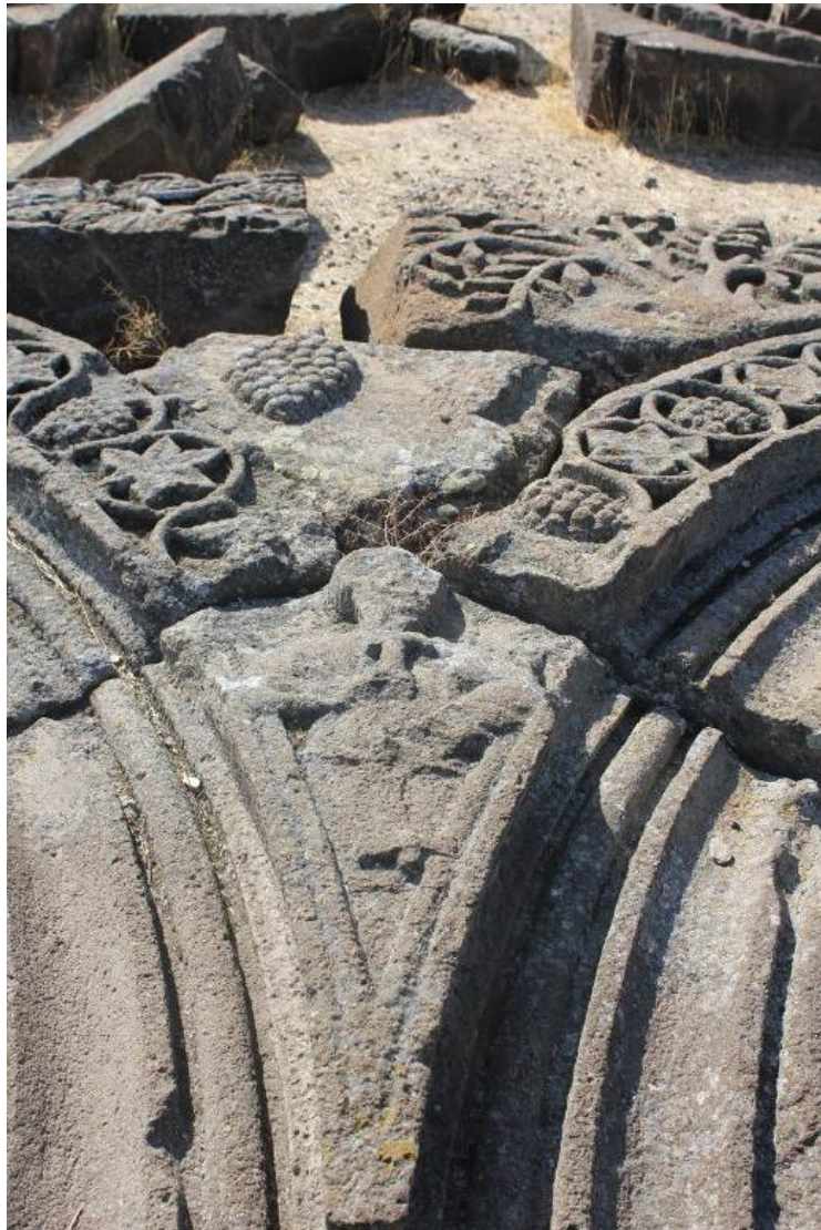
Илл. 9. Человеческая фигура с инструментом в руках. Звартноц, 652 г. Фрагмент внешнего рельефа на антрвольте первого яруса. Музей заповедник «Звартноц». Армения.

В композицию Райского сада Звартноца были включены изображения людей (сохранились только 11 фигур из 28 [или 32]), представленных на фоне все тех же райских деревьев и кустов. В специальной литературе эти фигуры трактуются как изображения строителей или заказчиков храма (Мнацаканян 1971. С. 52, 54; Магансі 2016. Р. 146–156). Трактуюя фигуры как заказчиков храма, Ст. Мнацаканян имел ввиду князей, которые финансировали постройку Звартоца. Однако такое мнение противоречит сведениям средневековых авторов, указывающих на то, что средства на постройку храма Нерсес получил от византийского двора (Movses Kałankatvac'i 1969. Р. 317).